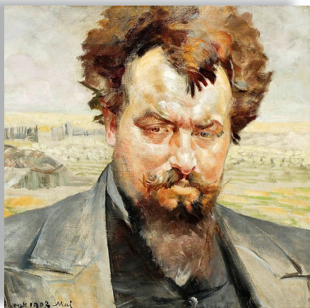
Portret Jana Kasprovicza, Jacek Malczewski, 1093 Muzeum Narodowe w Warszawie