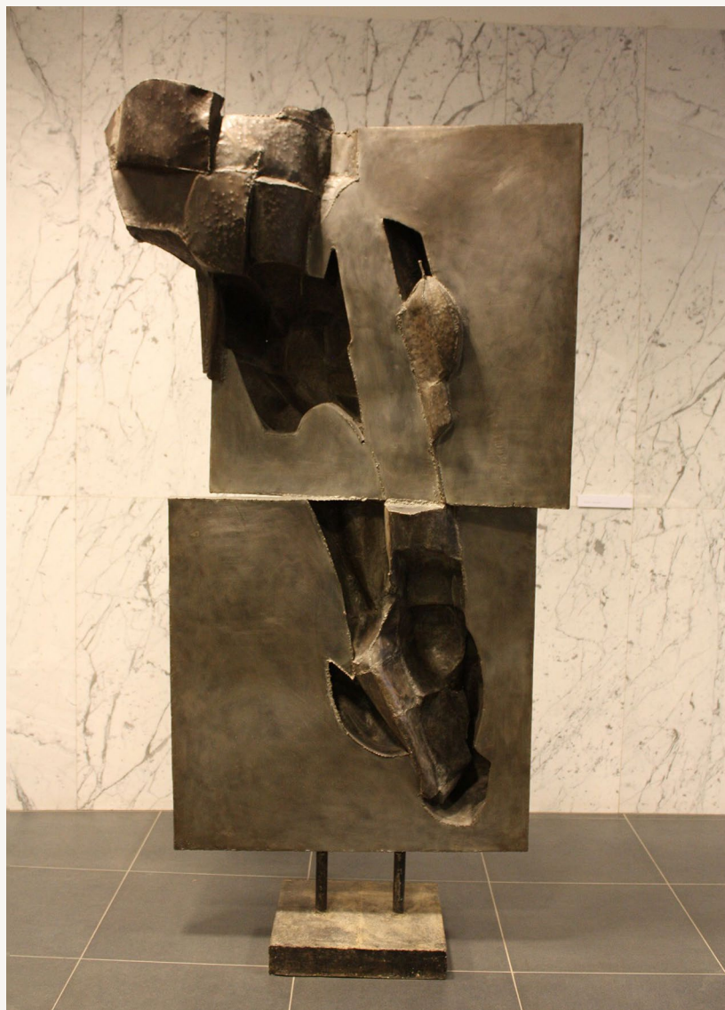
Józef Sękowski: Układ zmienny , 1974, (metal) 250x120 cm

(...) Józef Sękowski jest autorem jednego z najwybitniejszych polskich pomników. O pomniku Poległych Górników (Czechowice, 1981 r.) znakomity warszawski monumentalista Gustaw Zemła napisał: Autor nadał mu kształt najprostszy. Bryła sześcian, bryła węgla przecięta dwoma krzyżującymi się chodnikami (...) Autor świadomie stosuje tutaj zasadę kontrastu form, znak żywego krzyża i surowość geometrycznej bryły sześcianu dają efekt wstrząsający Jolanta Antecka