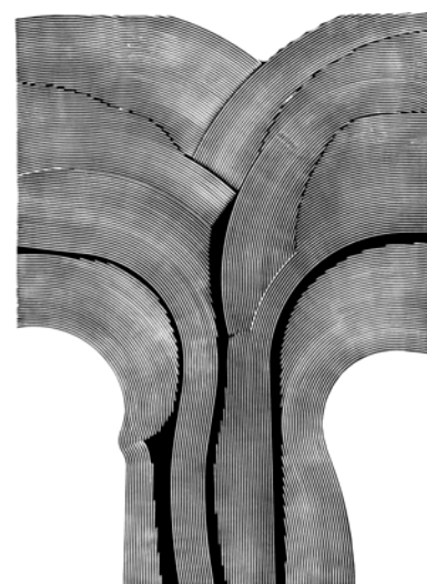
drugie lato mateusza 1973 gipsoryt (77×56)