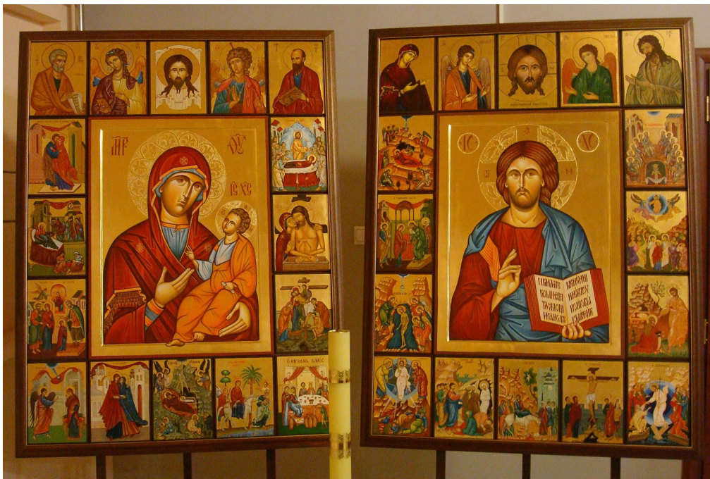
Ikona Jezusa Chrystusa i Najświętszej Marii Panny wraz z klemami narracji ewangelicznej wykonana przez o. Zygfryda Kota wraz z członkami Grupy Lumen przy Chrześcijańskim Stowarzyszeniu Sztuki Sakralnej „Ecclesia”.

O malarzu, który tworzy ikony, prawosławie mówi wręcz, że je pisze, a nie maluje. Ikona jest nie tylko wytworem ludzkiej wyobraźni, sztuki. Jest nade wszystko przekazem prawd wiary i jednocześnie doświadczeniem spotkania człowieka z Bogiem. Stąd jej zakorzenie w Biblii. Niekiedy faktycznie używamy określenia, że nie malujemy ikon, ale piszemy – jakbyśmy pisali Słowo Boże. Dlatego wymagana jest znajomość tych prawd. Malarz, malując ikony, nie tylko powinien znać to, ale powinien być