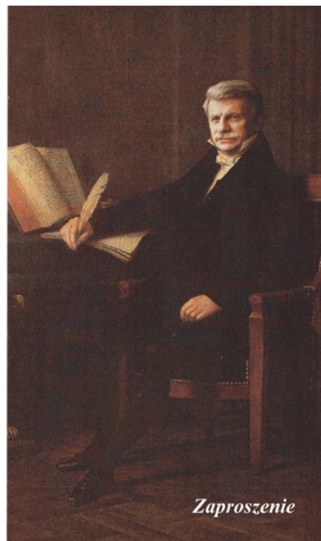
Na pierwszej stronie zaproszenia na wystawę w Bibliotece Jagiellońskiej wykorzystano fragment portretu Franciszka Ziejki autorstwa Konrada Pollescha.

Po wykładzie zapraszamy na wystawę pt. Wznosząc gmach narodowej wiedzy. 200. rocznica powołania Towarzystwa Naukowego Krakowskiego w holu Akademii.