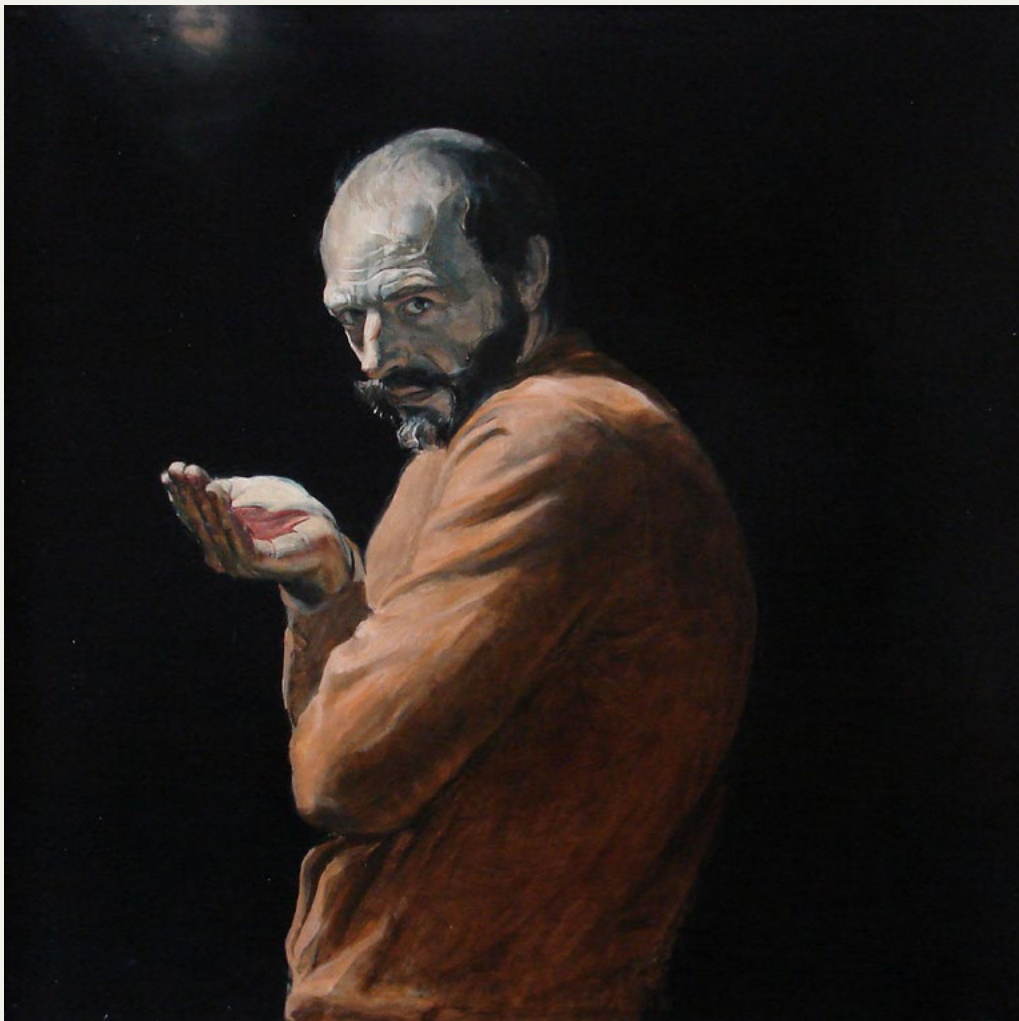
Narcyz , 1978 (olej na płótnie naklejonym na pilśni) 90 x 90 cm, własność Autora