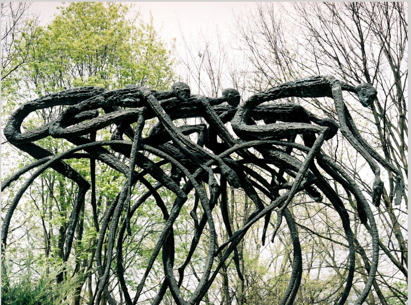
Kolarze, 2001 (brąz) fot. autora oraz rzeźby A. Kobos

Jego prace znajdują się w zbiorach m.in. Muzeum Narodowego w Warszawie, Krakowie, Poznaniu, Muzeum Medalierstwa we Wrocławiu, Muzeum Górnośląskiego w Bytomiu, Muzeum Śląskiego w Katowicach oraz muzeów w Oświęcimiu, Paryżu, Kopenhadze, Moskwie, Skopje, Helsinkach, Barcelonie, Dijon, Rawennie, Hasselt, Bochum i w Arezzo. oraz w kolekcjach prywatnych w kraju za granicą, m.in. w Austrii, Japonii, Australii, USA oraz Kanadzie.